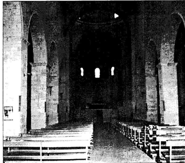
A lato la Cattedrale di Acerenza sopra un suo interno